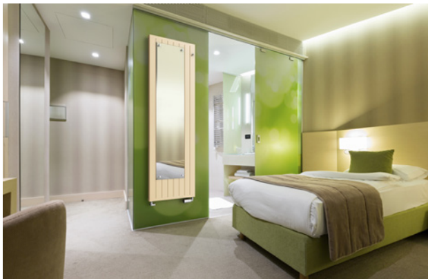
Onyx Mirror: radiátor se zrcadlem, barva: slonová kost, cena od 14 819 Kč s DPH MOC