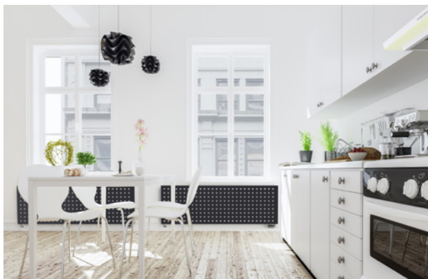
Europe: designový radiátor na vodní ohřev s umístěním pod okny, barva: RAL 9005, vertikální i horizontální varianty