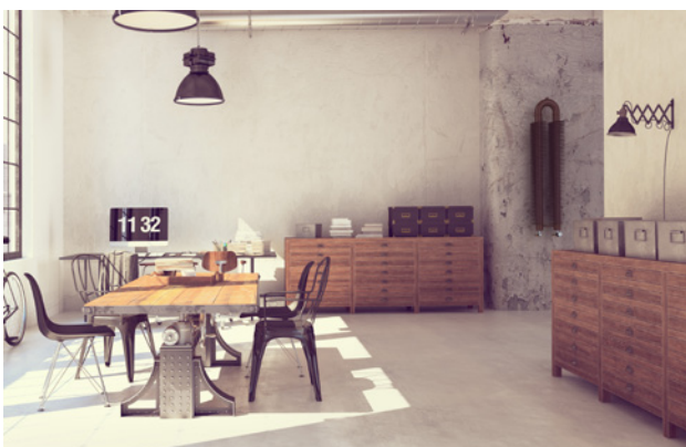
Retro Revolution: ocelové vinuté trubky mnoha rozměrů na obr. typ HO v RAL 8017