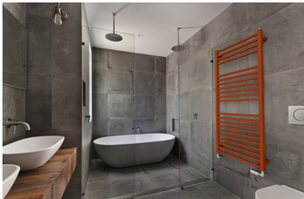
Ruby Bath Extra: koupelňový žebřík, barva: měděná metalíza, cena od 7 626 Kč s DPH MOC