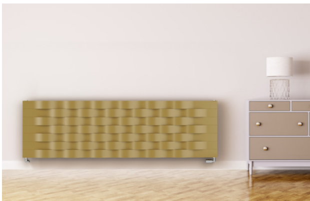
Waves: elegantní otopné těleso 1806x528 mm, barva: pískovcová HOTHOT 72, vertikální i horizontální varianty