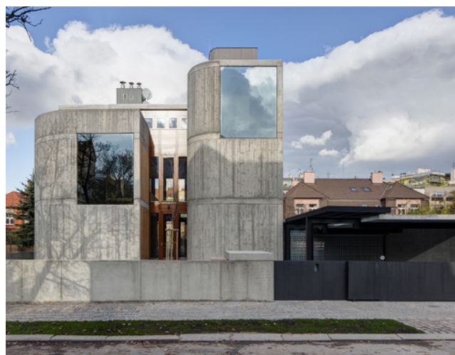
Josef Pleskot – AP Atelier / Vila v Podolí, Procházková ulice