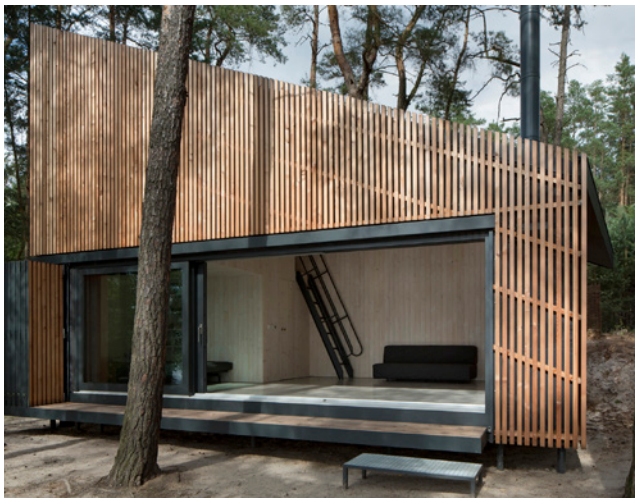
FAM Architekti / Chata u Máchova jezera