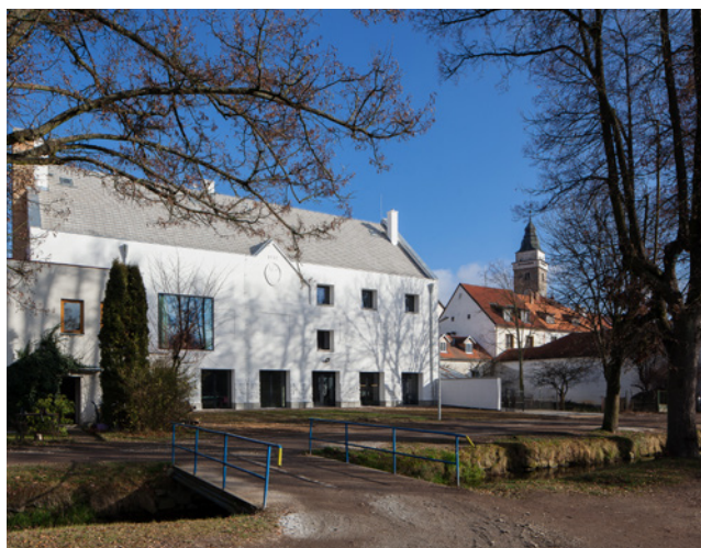
ov-a / Obnova Spolkového domu ve Slavonicích